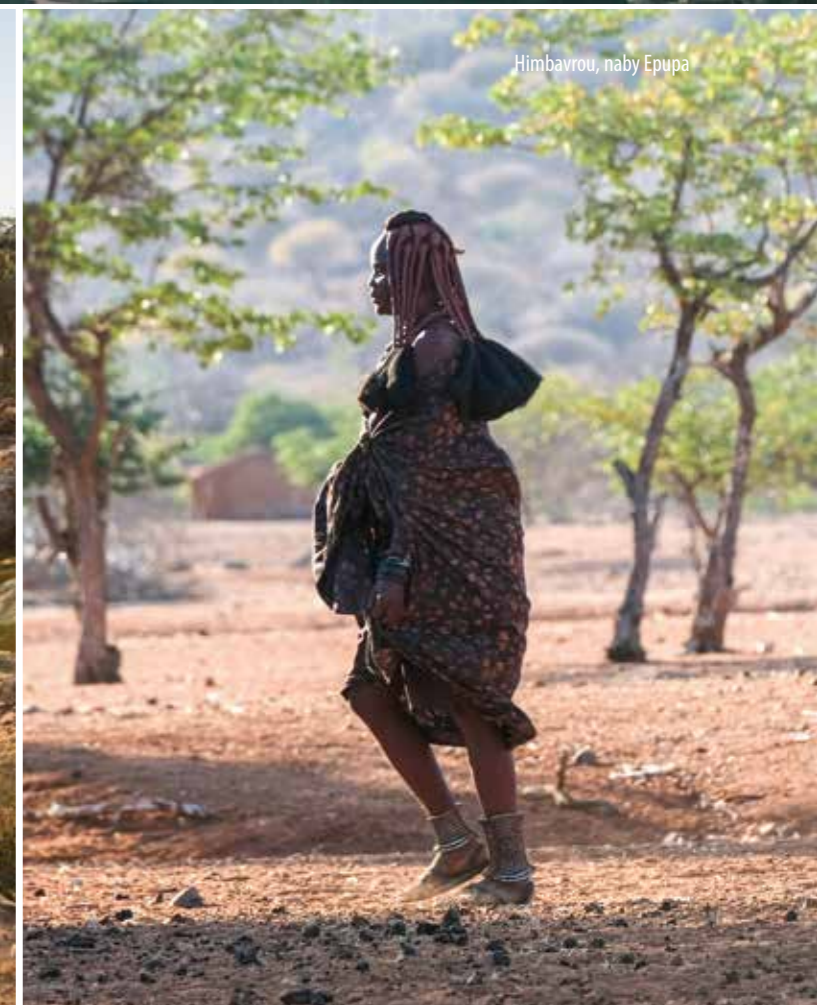
Himbavrou, naby Epupa